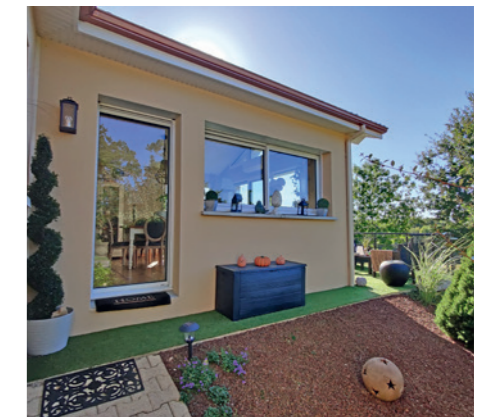
Destination : Salle à manger, séjour | Surface : 19 m 2 | Durée chantier : 6 mois | Mode constructif : Parpaing et enduit | Finition : Clé en main | Lieu des travaux : Landouge (87100)