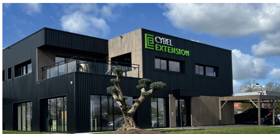
Siège social de Cybel Extension basé à La Chapelle-des-Fougerets (35)