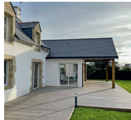
Destination : Cuisine | Surface : 46 m 2 | Durée chantier : 6 mois | Mode constructif : Parpaing avec enduit | Finition : Clé en main | Lieu des travaux : Saint-Philibert (56470)