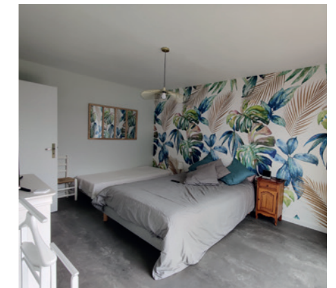
Destination : Suite parentale | Surface : 29 m 2 | Durée chantier : 5 mois | Mode constructif : Ossature bois et bardage bois | Finition : Prêt à finir | Lieu des travaux : La Geneytouse (87400)