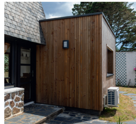
Destination : Cuisine | Surface : 25 m 2 | Durée chantier : 7 mois | Mode constructif : Parpaing et bardage bois | Finition : Clé en main | Lieu des travaux : Carnac (56340)