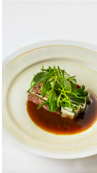
Agneau, sardines millésimées et algues du Croisic par Amaury Bouhours