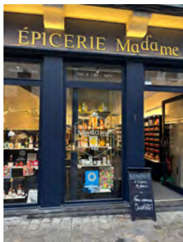
Épicerie Madame à Lille

L'entreprise combine un réseau de 1500 revendeurs en France et à l'export (épiceries fines, cavistes, restaurateurs) et une vente en ligne via le site internet officiel. Cette double stratégie de distribution vise à élargir l'accessibilité partout, tout le temps, des produits et à s'adapter aux différents modes de consommation.