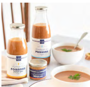
Soupes et bisques