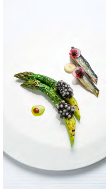
Sardines millésimées et asperges vertes rôties au citron noir crème au curry par Benjamin Pâtissier