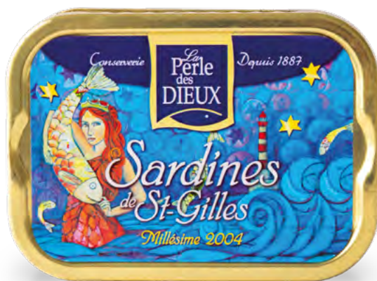
1 er millésime Mademoiselle Perle 2004