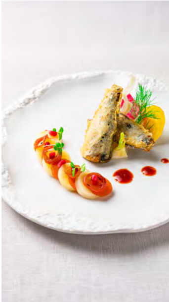
Sardines au piment d'Espelette en tempura, pomme de terre de l'île de Ré et légumes croquants par Grégory Coutanceau

La Perle des Dieux a co-crée avec quatre grands chefs, issus de différents horizons gastronomiques, un livre de recettes de saisons variées, ainsi qu'une section dédiée aux menus des fêtes, pour se régaler toute l'année avec des produits sains et des idées originales. Ce livre de recettes, distribué dans les magasins de marque, dans les librairies et les espaces culturels de France, est le reflet de son savoir-faire et de son engagement pour une cuisine savoureuse et créative.