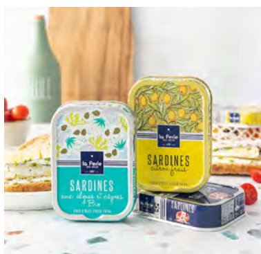
Sardines et anchois