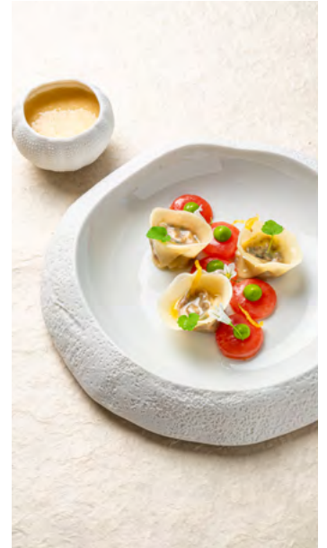
Ravioles de sardines au tartare de tomate, tomates marinées et poivre de Timut par Jean-Marc Pérochon