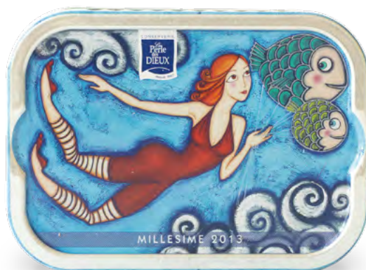
1 er millésime Mademoiselle Lulu 2013

Ainsi les tenues de Mademoiselle Lulu déclinées sur chaque boîte sont un clin d'œil à la finesse et l'exigence du métier de sardinière dans un univers joyeux, onirique et coloré.